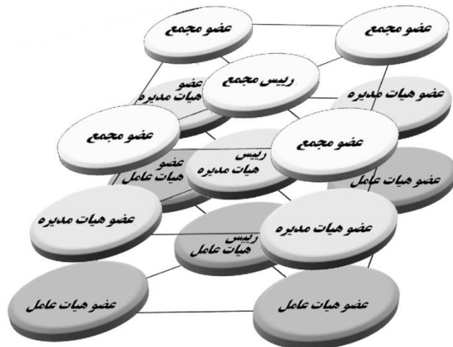
شکل (۳): طراحی چندلایه حاکمیت شرکتی در سطوح نظارتی، مدیریتی و اجرایی بانک

رباخواری بوده و نشان‌دهنده اهمیت انطباق با شریعت برای بانک یا مؤسسه اعتباری غیربانکی است که مدعی اسلامی بودن عملکرد خود است (میرحسینی، ۱۴۰۱). یکی از مهم‌ترین اثرات پیاده‌سازی حاکمیت شرکتی، ایجاد تضاد منافع برای شکل‌دهی تبانی و تمایل بیشتر برای مقابله با تقلب از مسیر توسعه ضوابط به‌عنوان عامل تنظیم‌کننده‌ی روابط است. موضوع حاکمیت شرکتی و نقش آن در بهبود عملکرد و کاهش تقلب در بانکداری اسلامی مباحث جذاب و درحال‌توسعه محسوب می‌شوند و بیشتر مطالعات در طی چند سال گذشته به‌صورت تدریجی در حال بررسی و توسعه تئوریک آن هستند و مطالعات در این زمینه می‌تواند در طی چند سال آینده بسیار پویاتر نسبت به امروز و گذشته باشد. حاکمیت شرکتی با اندازه هیأت‌مدیره، دوگانگی مدیرعامل، اندازه کمیته حسابرسی، ساختار مالکیت و تنوع جنسیتی اندازه‌گیری می‌شود. برای کسب نتایج قوی، این مطالعه عملکرد بانک را با در نظر گرفتن شاخص‌های مختلف، یعنی بازده دارایی‌ها، سود هر سهم، کارایی فنی و بهره‌وری کل عوامل اندازه‌گیری می‌کند. اثر تعدیل‌کننده مالکیت بر ارتباط بین حاکمیت شرکتی و عملکرد مالی در بانک‌ها تأثیر مثبتی بر عملکرد دارند. یافته‌ها نشان می‌دهد که حاکمیت شرکتی خوب ارزش ایجاد می‌کند و باید منافع همه ذی‌نفعان تقویت شود.