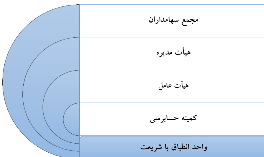
شکل (۱): چارچوب نظارت شرعی بر سطوح حاکمیت شرکتی نظام بانکی

آنچه در این خصوص حائز توجه است چارچوب نظارتی پذیرفته شده‌ای است که برای عملکرد نظام بانکی با شریعت در نهادهای ارائه‌دهنده خدمات مالی اسلامی مورد استفاده قرار می‌گیرد.